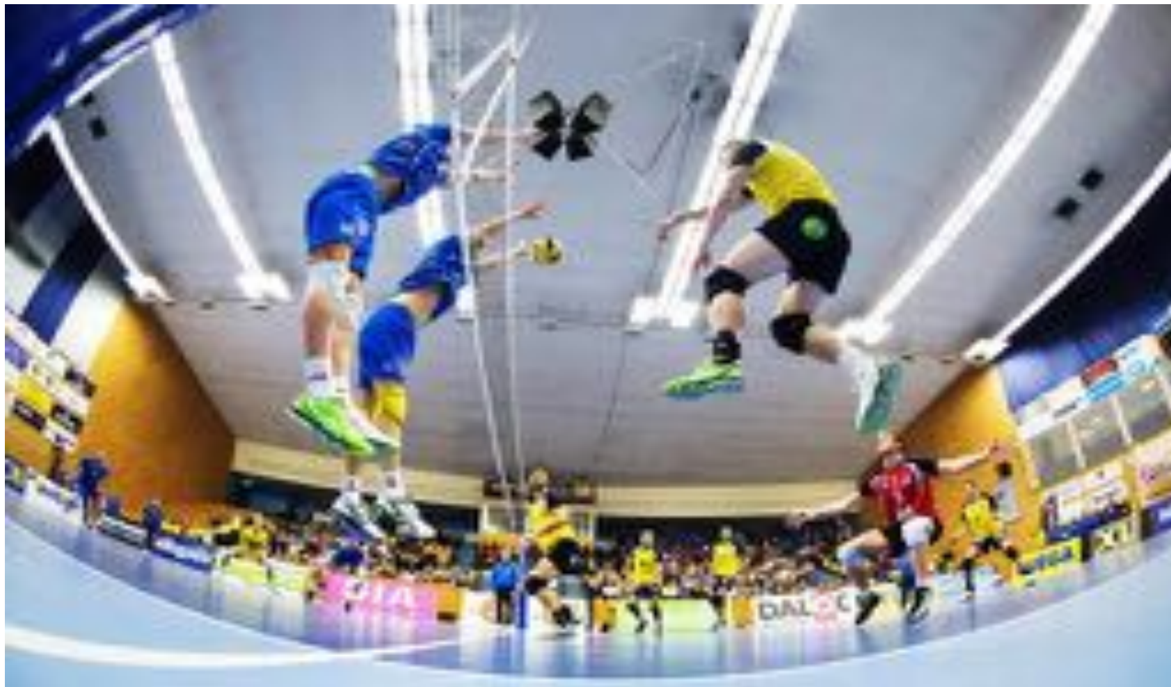
Ferdinando De Giorgi