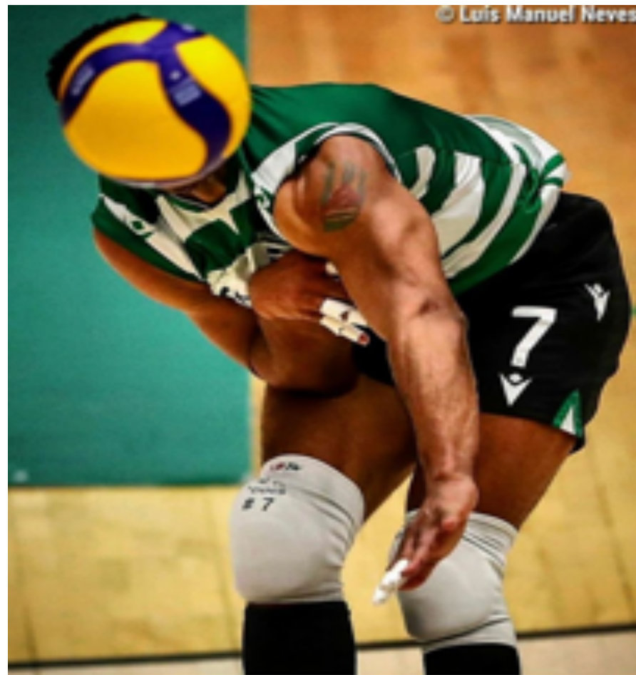
Ferdinando De Giorgi