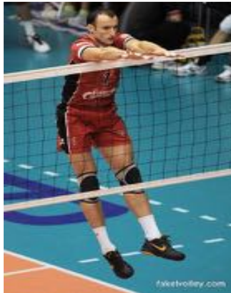
Ferdinando De Giorgi