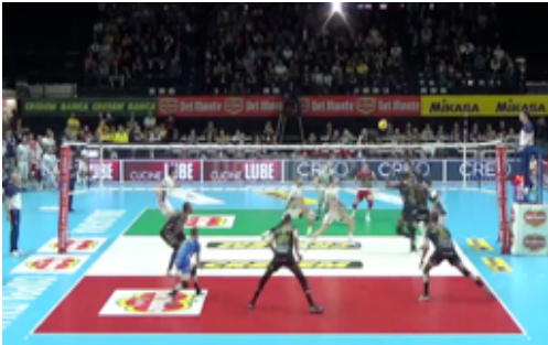
Muro a tre