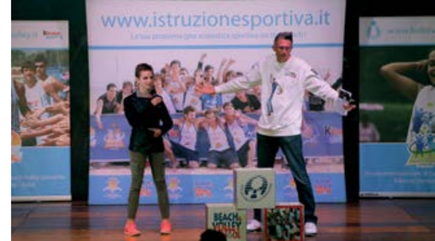
Beatrice Vio campionessa paralimpica e mondiale di fioretto individuale Andrea Lucchetta ex pallavolista della Nazionale

L'esperienza del viaggio contribuirà a migliorare l'autonomia degli adolescenti, educandoli alla convivenza di gruppo e favorendo il rispetto delle regole comuni.