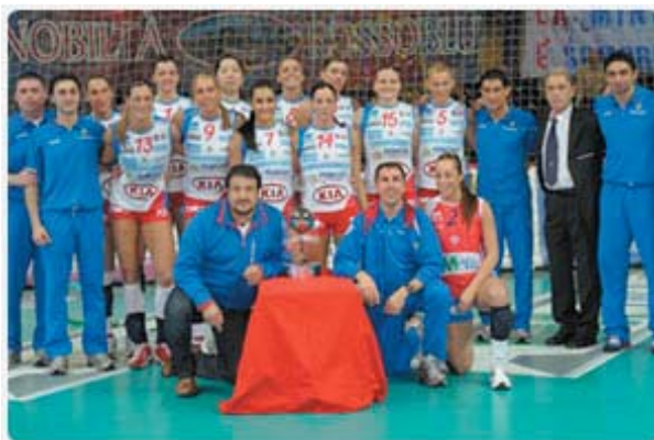
La Foppa con la Champions League appena vinta