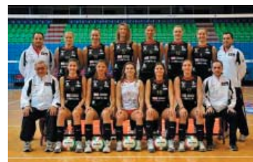
L'Europea 92 Original Marines Milano