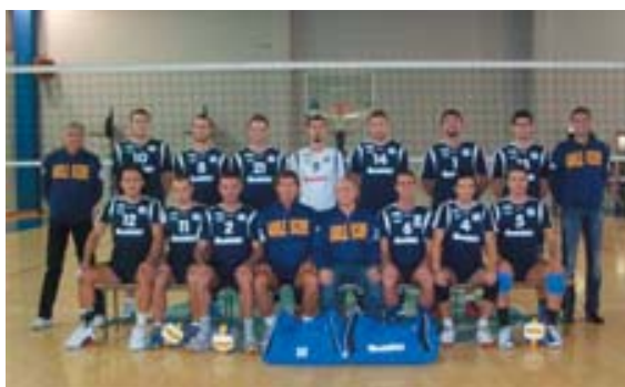
Il Centro Adolescere Voghera

W eeek-end di pausa al termine del girone di andata dei campionati regionali di C e D. L'occasione per festeggiare i dieci anni di Volleyland a Forlì e per fare il punto prima di affrontare il lungo sprint finale. In C maschile la regina assoluta è indubbiamente il Centro Adolescere Voghera. Gli iriensi guidano il girone A imbattuti e a punteggio pieno. In tredici partite, Voghera ha concesso agli avversari solo